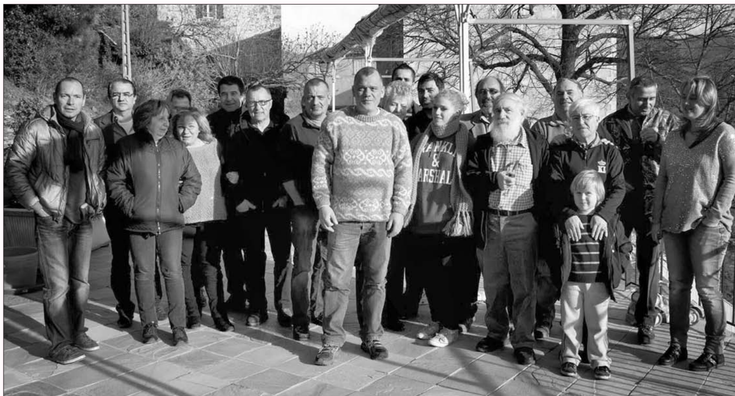
Les membres de l'association Terra è omi di Castagniccia lors de leur assemblée générale à Piedicroce

Reste à espérer une météo clémente pour ce prochain week-end pascal, ingrédient favorable au déplacement du public... Même si la « Fiera di Castagniccia » ne manque pas d'atouts séducteurs pour pallier les mauvaises conditions météorologiques !