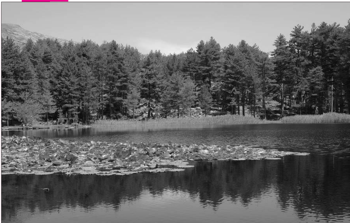
Le lac de Crenu

Enfin, notre troisième objectif est le soutien au développement de filières porteuses : agriculture, sylviculture... Nous visons l'agriculture professionnelle qui sera marquée «Parcu di Corsica». Elle constituera un complément d'attractivité des activités de pleine Nature pour un développement cohérent à forte identité.