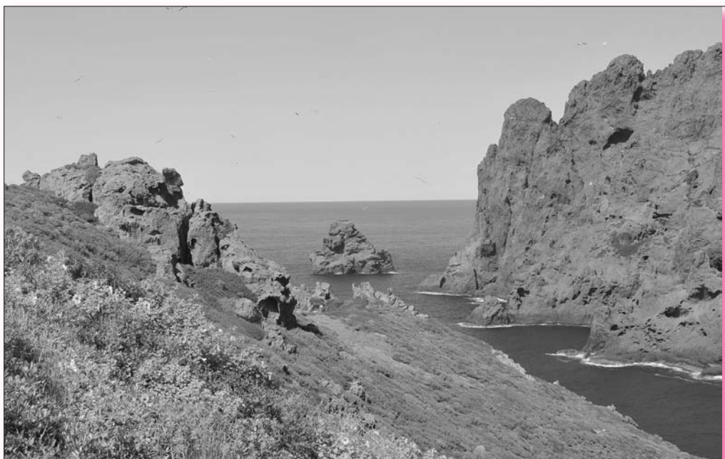
La réserve de Scandola