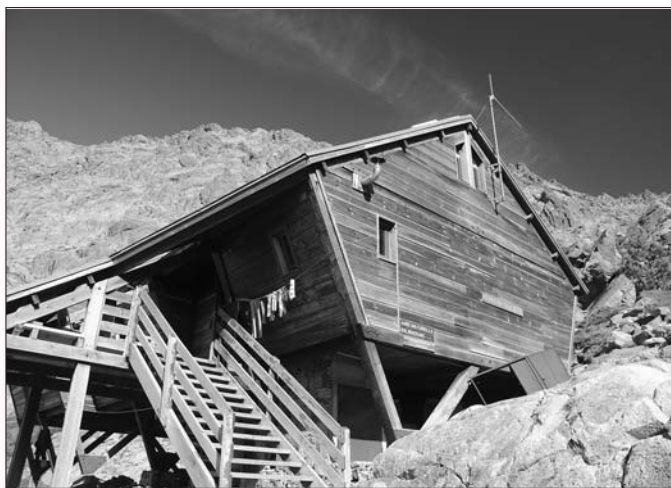
Le refuge de Tighjettu

Permettez-moi un petit historique pour mieux faire comprendre l'évolution. A partir de 2002, le Parc avait mis en place une procédure de délégation de service public pour les treize refuges du