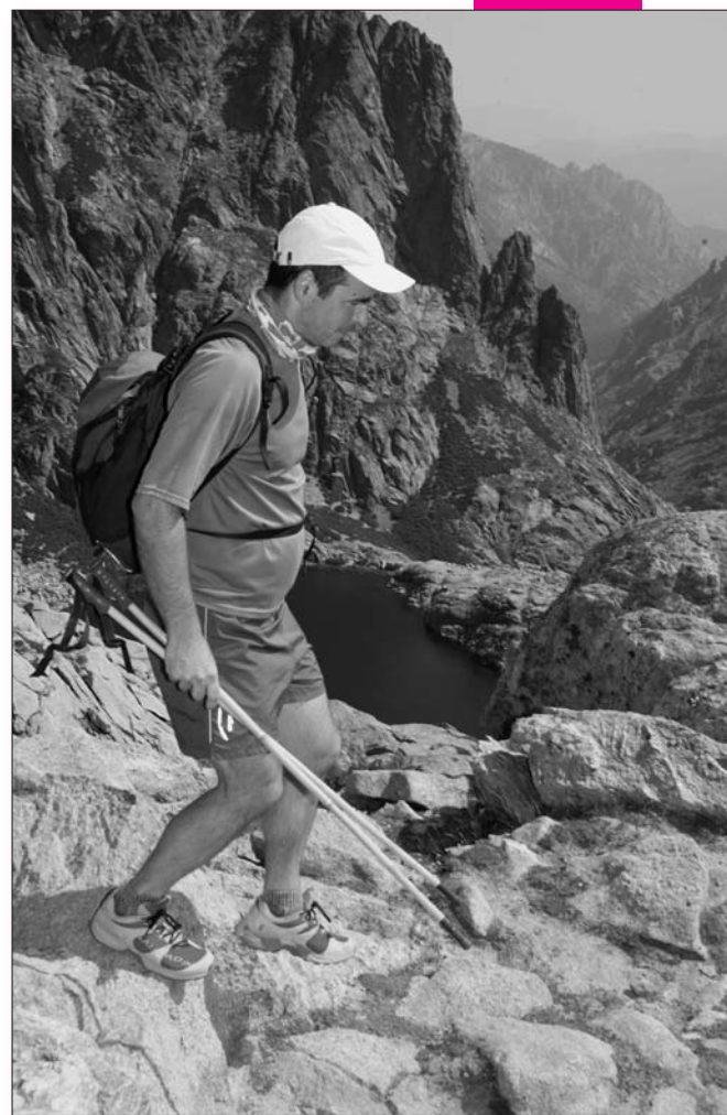
Le GR20, vitrine de la Corse et du Parc Naturel

moines, notamment archéologiques, ou encore la structuration des équipements d'accueil, de pédagogie et de formation sont des axes prioritaires pour assurer le renouveau du tissu rural de l'île avec un statut fiscal particulier pour cette zone.