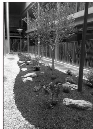
Le patio végétalisé créé au collège de Biguglia par les élèves du Lycée Agricole de Borgo