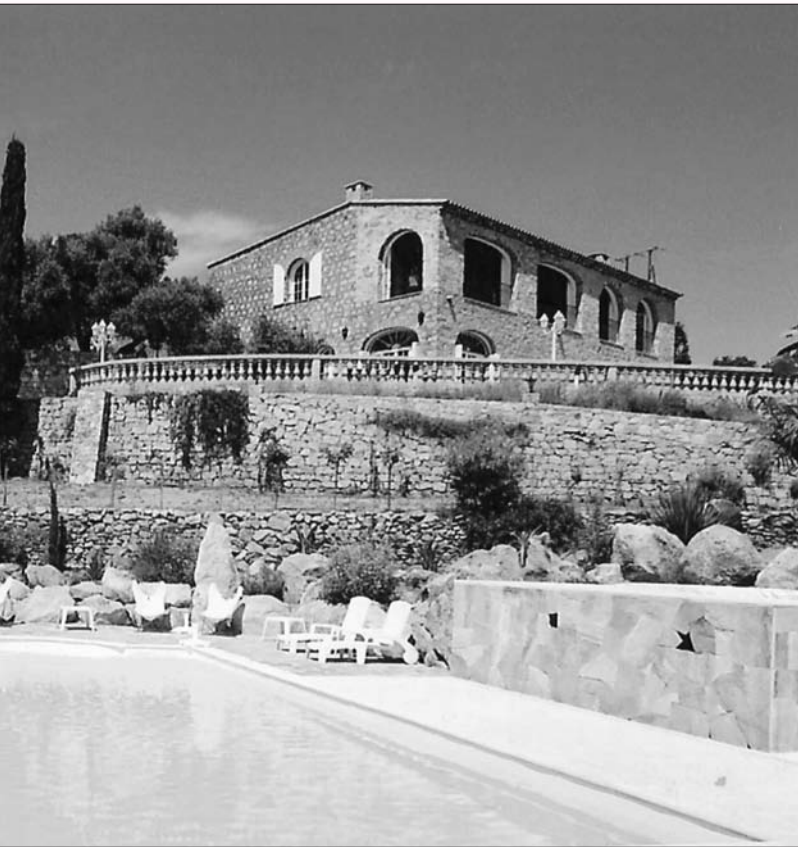
Chemin Saint Antoine 20260 Calvi - N° d'agrément Clévacances : 2BMS01090