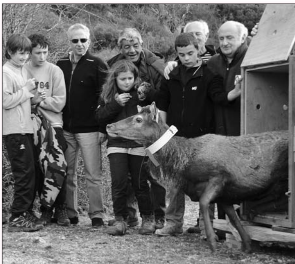
Lâcher de cerf au Parc en 2012, près de Letia

La charte du Parc engage une politique qui se veut innovante et visionnaire puisqu'elle se projette à l'horizon 2025. Elle se veut être le support du